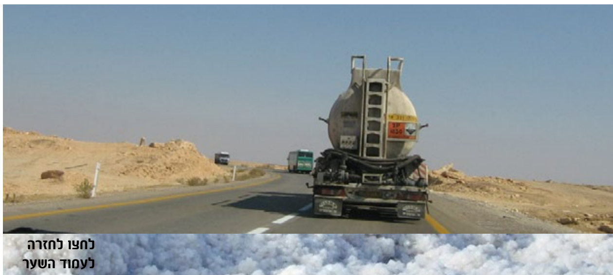
לחצו לחזרה לעמוד השער

הנושא התעורר בשל הצורך לקצור את המלח, שהצטבר בים המלח בין השאר עקב פעילות המפעלים ליצור אשלג. מדובר בעלות של 3.8 מיליארד שקלים, והמדינה דרשה שכי"ל, הבעלים של מפעלי ים המלח, היא שתישא בעלויות. בהזדמנות זו, שוב עלתה סוגיית תשלום התמלוגים של כי"ל למדינת ישראל עבור השימוש במשאב הלאומי.