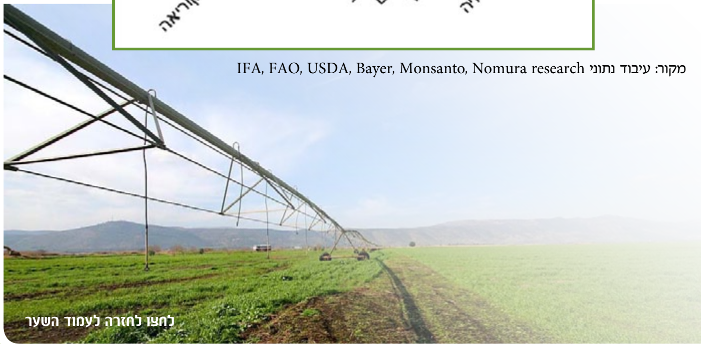
לחצו לחזרה לעמוד השער